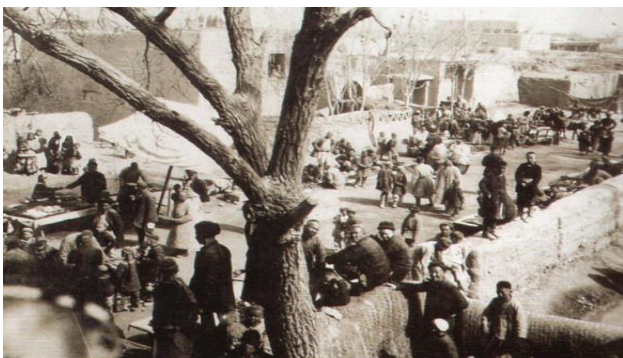
圖 4 民國 17 年 6 月 15 日攝於輪臺“八雜”現場

老師不但中文底字深厚（參見圖 2 氣象歌），喜愛攝影，亦喜寫生素描。在擔任我國西北科學考察團天氣觀測期間他留下兩千餘張照片，與未計其數的寫生成品（圖 4、5）。