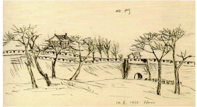
圖 5 民國 17 年 10 月 2 日繪於哈密北門同天還繪過西門

按西域“八雜”與其他地方“趕集”類同，也就是有交易與遊樂之地攤式市場，我國東北與西北以及華北地區都很盛行，其他地區（如高雄岡山）亦多見。