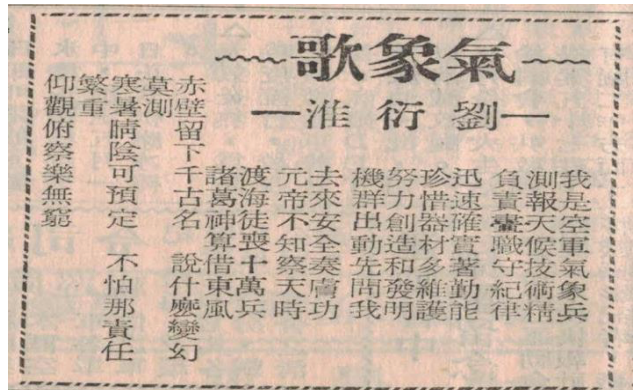
圖 2 劉師親撰之氣象歌

遣之使臣，他分別於至元 11 年(1274)年農曆冬 10 月，與 7 年後的 7 月(4 月已分由高麗舟山啟航，但 7 月始南北會師)發兵征伐日本，前者遇強寒流，甚至於是爆發性氣旋，後者遇颱風(圖 3)，都以兵敗收場！